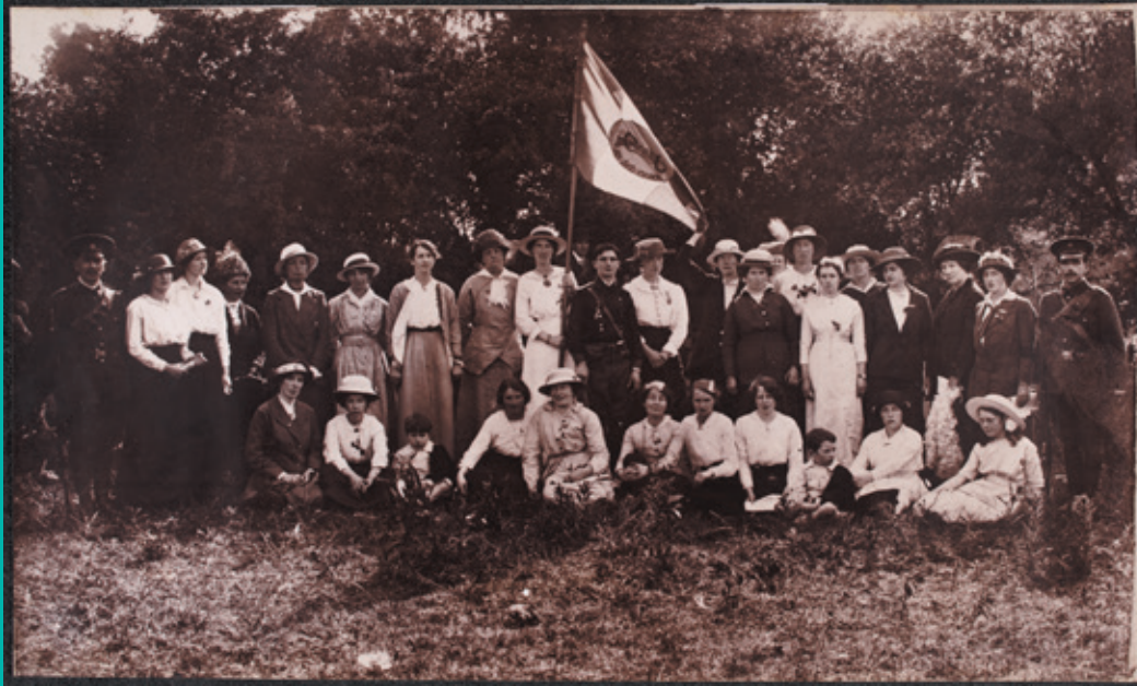
Grianghraf gan dáta de chruinniú Ard Chraobh Chumann na mBan. Tá Kathleen Clarke ina súl ar chlé ar fad an grúpa. Is féidir tuilleadh a fháil amach faoin ngrianghraf seo (NPA CNB) ag http://catalogue.nli.ie/Record/vtlsooo276947