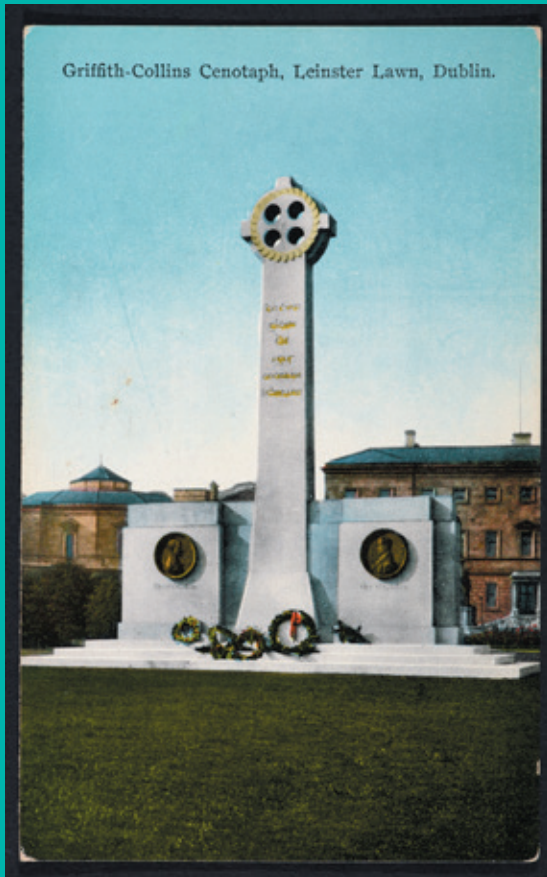
Leacht Cuimhneacháin Griffith-Collins, Leinster Lawn, Dublin. Thug an léacht cuimhneacháin seo, a nochtadh sa bhliain 1923, comhonóir do Griffith agus Collins.