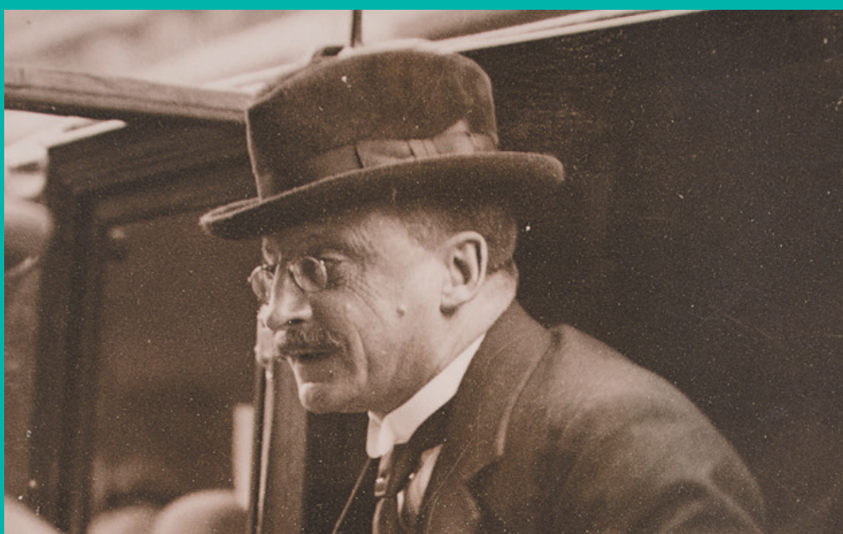
Tagann Arthur Griffith go Downing Street, London le haghaidh idirbheartaíocht maidin 11 Deireadh Fómhair. 1921. Is féidir tuilleadh a fháil amach faoin ngrianghraf seo (NPA MKN30) ag http://catalogue.nli.ie/Record/vtlsooo7