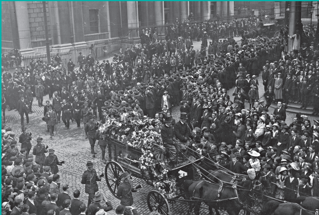
Sochraid Arthur Griffith ag fágail City Hall i mBaile Átha Cliath, mar a raibh sé ina luí faoi ghradam stáit, ar 16 Lúnasa 1922. Is féidir tuilleadh a fháil amach faoin ngrianghraf seo (Ke 167) ag http://catalogue.nli.ie/Record/vtlsoooo030679