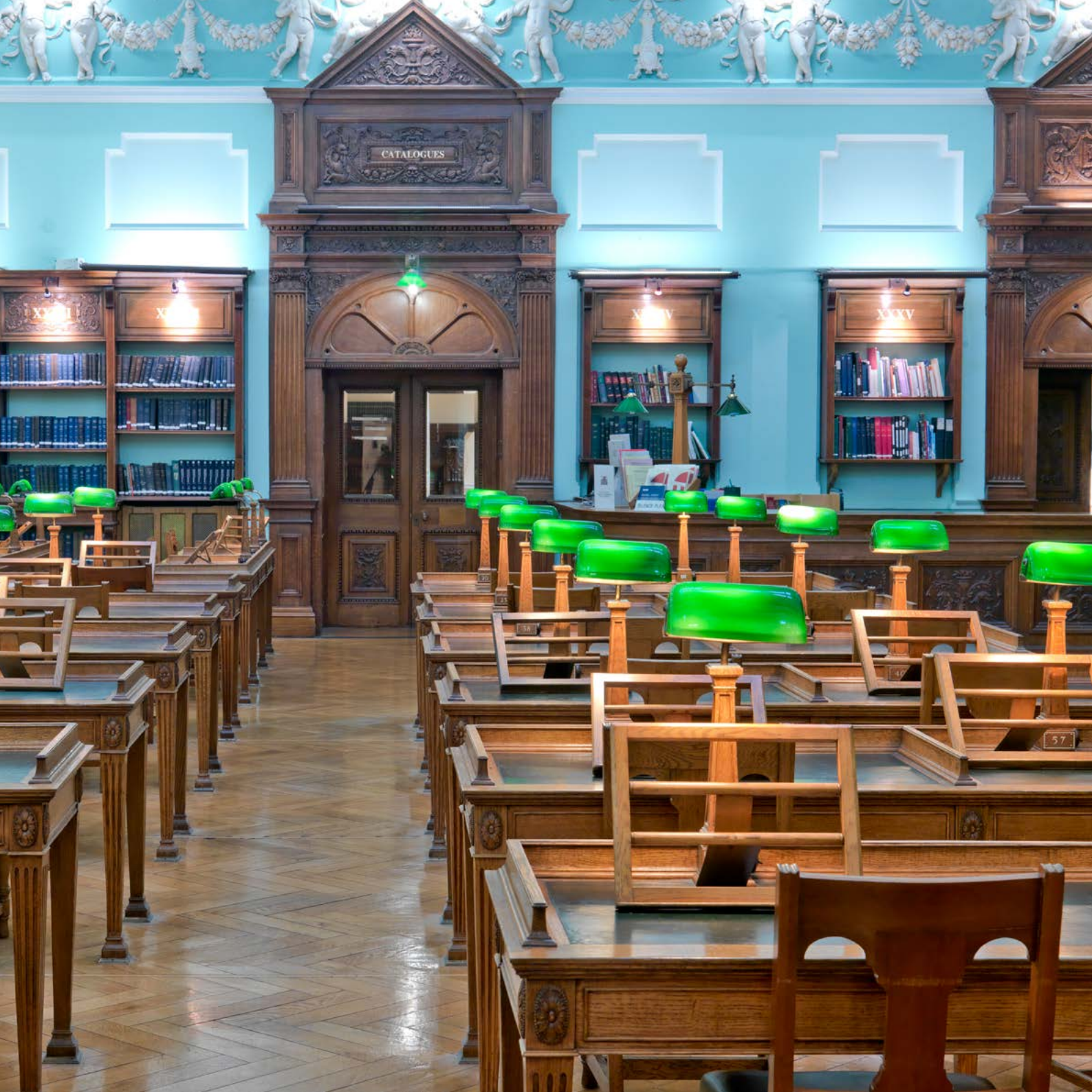
Deasca léachtóirí sa Phríomhsheomra Léitheoireachta.