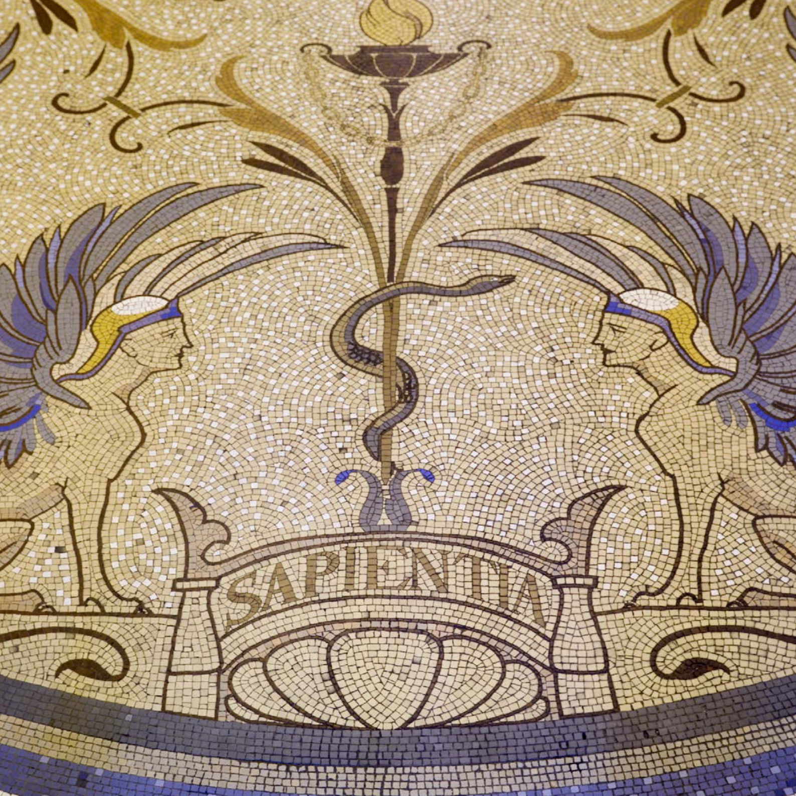
Sapientia (eagna), mionghné den mhósaic urlár i halla an bhealaigh isteach.