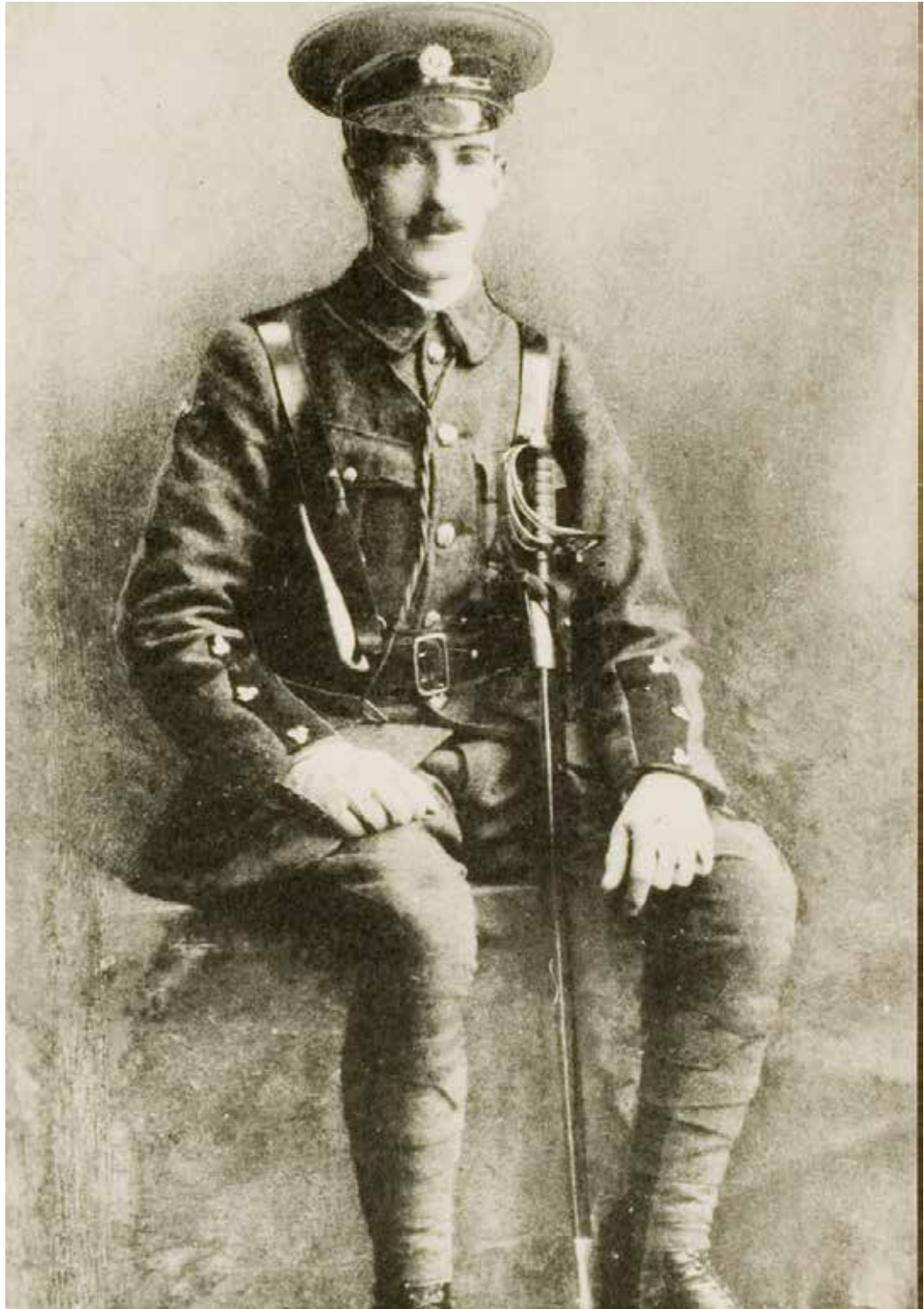
A commemorative postcard for Edward Daly in the uniform of the Irish Volunteers. He was described as having a serious expression, a pale complexion and dark sad eyes.