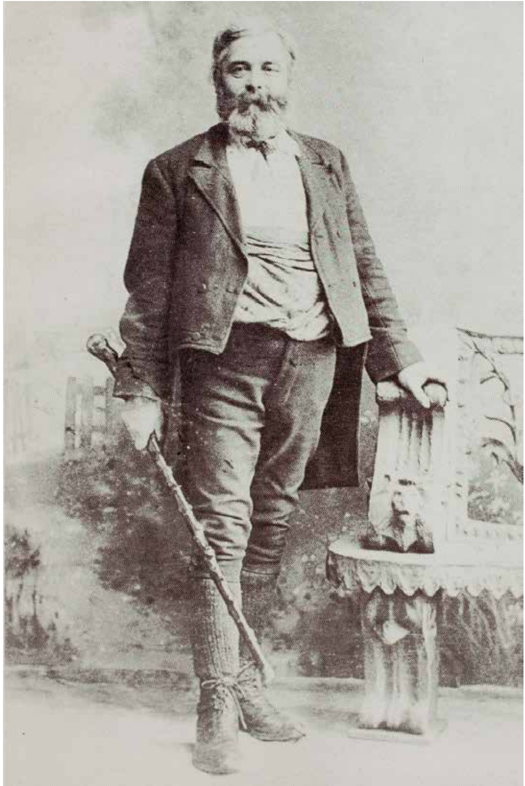
Michael Cusack; he has been immortalised as 'The Citizen' in James Joyce's Ulysses.