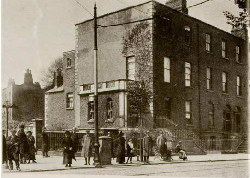
No. 25 Northumberland Road. (Dublin and the “Sinn Féin” Rising, Wilson Hartnell & Co., 1916).