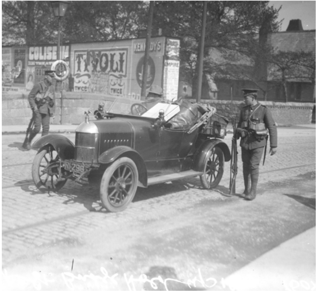
Troops inspecting a motor car on Mount Street Bridge after the fighting.