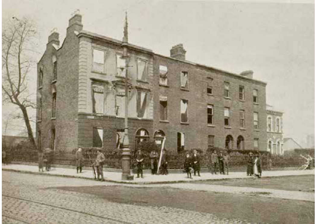
Clanwilliam House following the battle. (Dublin and the "Sinn Féin" Rising, Wilson Hartnell & Co., 1916).