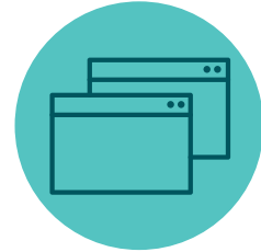
4 .Cartlannú roghnaitheach gréasáin.

Déantar bainistíocht ar ghníomhaíocht bhailithe thar trí réimse bailiúcháin de chuid na